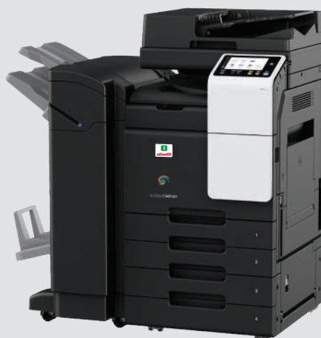
mit FS-539SD und PC-218