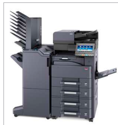
d-Copia 3201MF (bzw. d-Copia 4001MF) + DP-7110 + PF-791 + DF-7110 + AK-740 + MT-730(B)