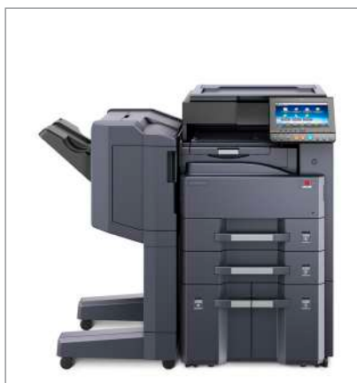
d-Copia 3201MF (bzw. d-Copia 4001MF) + Abdeckung Typ (E) + PF-810 + DF-7120 + AK-740